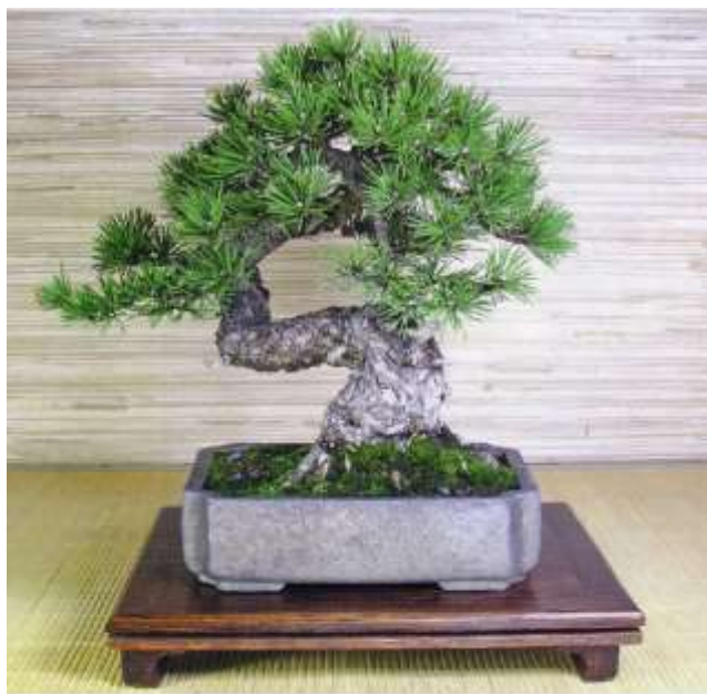
Pin à crochet

L'utilisation d'une tablette permet de donner une transition entre le support et l'arbre. Elle lui donne une apparence de dignité et renforce sa présence. L'ensemble arbre, pot et tablette doit être en l'harmonie sans oublier que le sujet principal est le bonsaï.