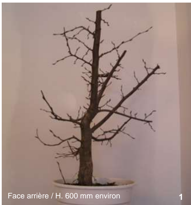
Face arrière / H. 600 mm environ

Les seules parties de l'arbre pouvant être mises en valeur étaient les coudes imprimés au tronc (Voir photo 2). J'ai donc décidé de tout reconstruire autour de ces deux coudes qui par chance orientaient le tronc dans les 3 axes. Il est très important à ce stade de se projeter et de savoir où l'on veut aller, vers quel projet.